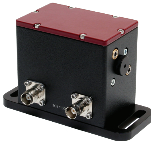
Оптический блок селектора OG-B для Ti:S фс лазера

В фемто- и пикосекундной лазерной технике наиболее распространены следующие применения селекторов одиночных импульсов с фиксированной длительностью окна пропускания: