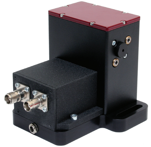
Оптический блок селектора OG-V для Yb фс лазера

В фемто- и пикосекундной лазерной технике наиболее распространены следующие применения селекторов с регулируемой длительностью окна пропускания: