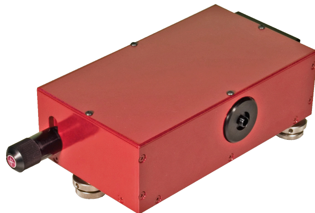
Перестраиваемый универсальный спектрометр ASP-150T